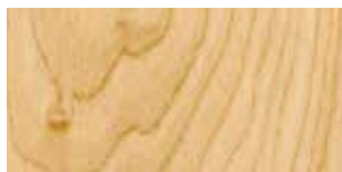
BETULLA NATURALE NATURAL BIRCH