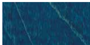
BETULLA TINTA BLU COBALTO BIRCH COBALT BLUE STAINED