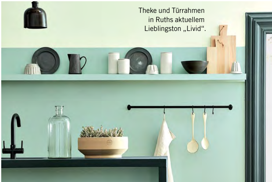
Theke und Türrahmen in Ruths aktuellem Lieblingston „Livid“.