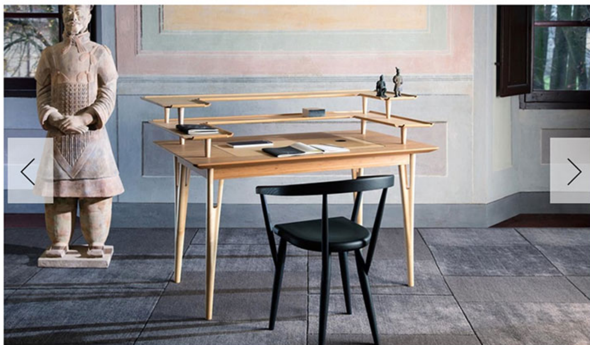
1-2 ADELE-C, LO SCRITTOIO VICTOR DI MARIO AIRÒ.