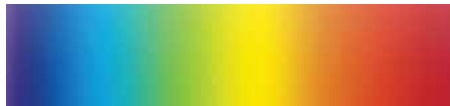
IL TAVOLO PUO' ESSERE LACCATO ANTIGRAFFIO IN COLORE SCELTO DAL CLIENTE. THE TABLE CAN BE LACQUERED IN THE COLOUR CHOSEN BY THE CUSTOMER, OPAQUE SCRATCH-PROOF FINISH