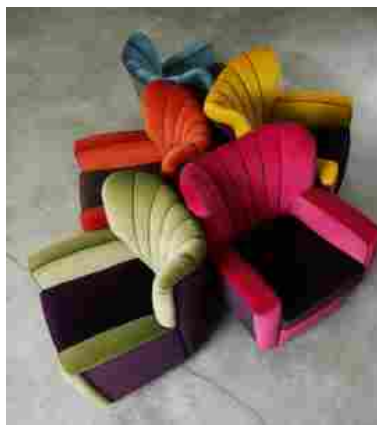
Adele-C “Zarina baby”, disegnata da Cesare Cassina nel 1944 per sua figlia Adele, è riproposta dal 2009 in velluto bicolore e nella versione personalizzabile “La mia Zarina”.

Zarina è una classica bergère morbida e accogliente. Il solido fusto in legno, il cuscino in piuma d’oca, le finiture accurate sono il simbolo di una tradizione che ha radici in Brianza, a Meda e dintorni, e che proprio qui, nel secondo dopoguerra, trova le idee e le energie per la propria evoluzione. Il mobile, classico e su misura, lascia il passo al design industriale, i laboratori artigianali si trasformano in imprese, l’architetto ha un ruolo centrale nel ri disegnare oggetti e arredi che mutano radicalmente la scenografia delle nostre case.