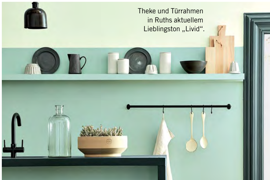
Theke und Türrahmen in Ruths aktuellem Lieblingston „Livid“.