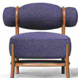
GEBRÜDER THONET VIENNA DESIGN CHIGNON LUCIDIPEVERE, POLTRONCINA CON STRUTTURA IN LEGNO CURVATO LACCATO, SCHIENALE E SEDUTA IMBOTTITI E RIVESTITI IN PELLE ARMCHAIR WITH STRUCTURE IN CURVED PAINTED WOOD, PADDED SEAT AND BACK COVERED IN LEATHER. gebruederthonetvienna.com