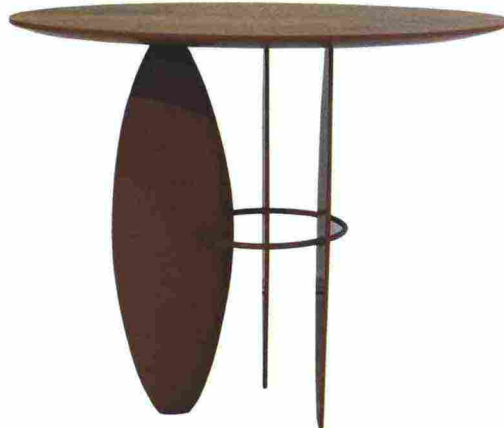
AUCAP DESIGN LEO DI CAPRIO PABLO, TAVOLINO IN LEGNO PEROBA DO CAMPO E LACCA DISPONIBILE ANCHE NELLA VERSIONE OTTONE E QUARZO TABLE IN PEROBA DO CAMPO WOOD AND LACQUER, ALSO AVAILABLE IN THE BRASS AND QUARTZ VERSION aucap.com.br