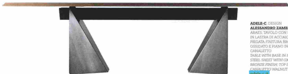
ADELE-C DESIGN ALESSANDRO ZAMBELLI ARAES, TAVOLO CON BASE IN LASTRA DI ACCIAIO PIEGATA FINITURA BRONZO OSSIDATO E PIANO IN NOCE CANALETTO TABLE WITH BASE IN BENT STEEL SHEET WITH OXIDIZED BRONZE FINISH, TOP IN CANALETTO WALNUT adele-c.it