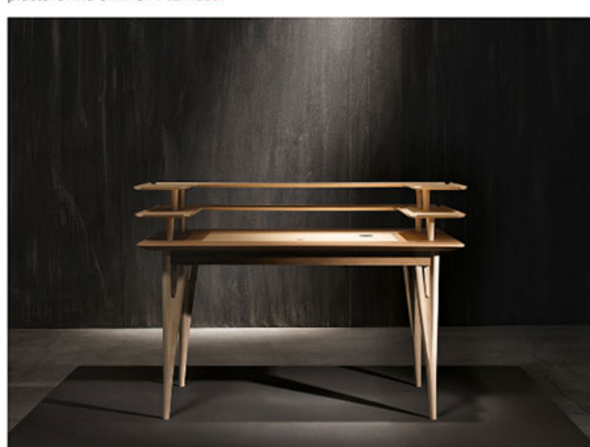
Nell'immagine di copertina, scrittoio Victor e sedia Lina by Adele-C

Victor è presente – insieme alle altre collezioni del brand – all'interno dello showroom milanese di Adele-C ed è inoltre acquistabile all'interno della piattaforma online Artemest .